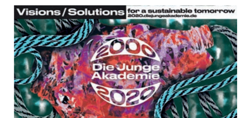
Online-Wettbewerb »Visions/Solutions« der AG Nachhaltigkeit Grafik: State, Agentur für Design

Am Jahresende schrieb die AG Nachhaltigkeit den Online-Wettbewerb »Visions/Solutions« aus, für den sie digitale Beiträge sucht, die sich visionär oder konkret mit einer nachhaltigen Zukunft auseinandersetzen. Die Gewinnerinnen werden die Gelegenheit bekommen, ihre Ideen mit hochkarätigen Wissenschaftlerinnen zu diskutieren. Der Wettbewerb soll den medial verbreiteten Bildern des Klimawandels als nahender Katastrophe Ideen und Initiativen für einen positiven Wandel entgegenstellen.