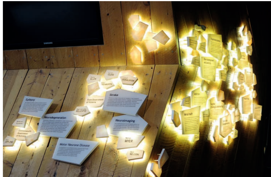
Klanginstallation »Ubiquity« in Melbourne