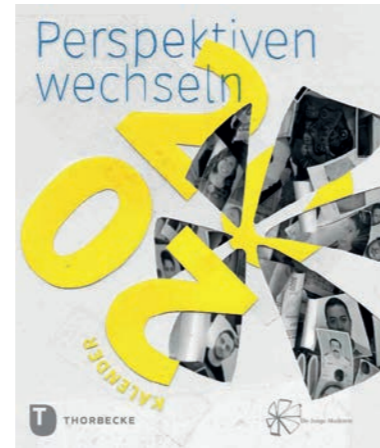
Kalender 2020 »Perspektiven wechseln« Gestaltung: Finken & Bumiller

Das Veranstaltungs- und Öffentlichkeitsarbeitskonzept hat zum Ziel, ein breiteres und teils neues Publikum zu erschließen, das die Aktivitäten der Jungen Akademie zukünftig weiter begleitet. Das Motto der Festveranstaltung 2020 „Perspektiven wechseln“, spiegelt sich auch im Kalender der Jungen Akademie für 2020.